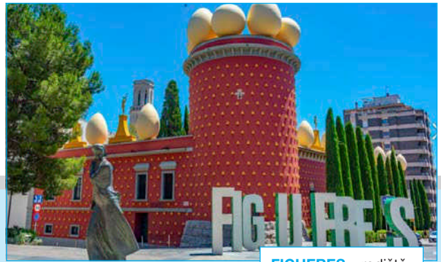
FIGUERES – rodiště Salvadora Dalí