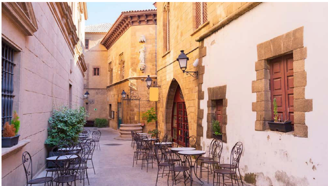
Španělská vesnice Poble Espanyol v Barceloně

Mezi známé turistické cíle patří právě Gaudího díla jako bazilika Sagrada Família - architektonický skvost, který kombinuje maurskou inspiraci, křesťanskou symboliku a fantaskní secesní ornamentalistiku, domy Casa Milà a Casa Batlló či park Güell. Známa je i gotická čtvrť Barri Gòtic s katedrálou svatého Kříže a svaté Eulálie. Na hoře Montjuïc, kde se r. 1929 konala světová výstava a r. 1992 Olympijské hry, se nachází Katalánské národní umělecké muzeum nebo Fundació Joan Miró, pod ní magická fontána, Barcelonský pavilon a Španělské náměstí. Dalšími známými místy jsou Kolumbův sloup a fotbalový stadion Camp Nou.