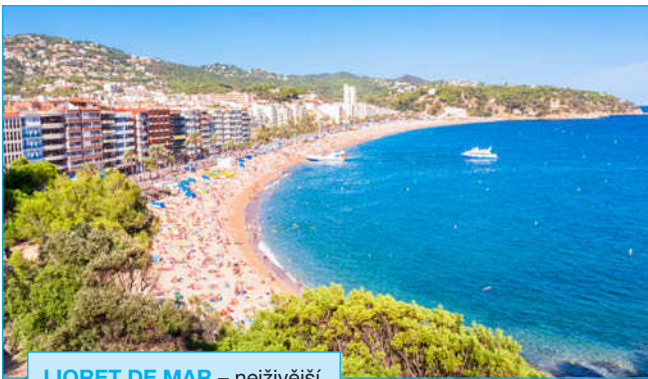
LILORET DE MAR – nejživější letovisko pobřeží