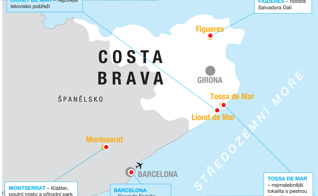
MONTSERRAT – Klášter, poutní místo a přírodní park